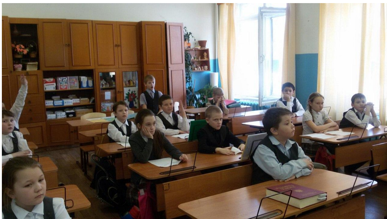
Фото с мероприятия

Сережа Ш.: Меня поразило, что после войны, когда взрослых не оставалось, детям приходилось разминировать нашу землю и на небольшом клочке земли порой оказывалось очень много погибших наших солдат.